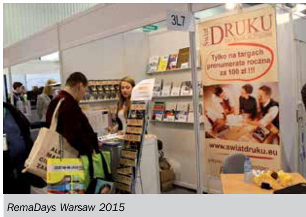
RemaDays Warsaw 2015

Więcej informacji można znaleźć na stronie na www.remadays.com .